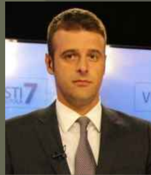
Potpredsjednik Kordinator projekta