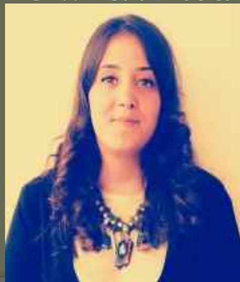
Asistentkinja na projektu