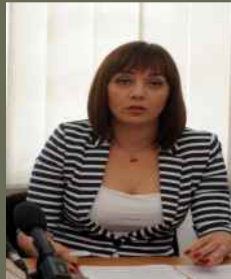
Predsjednica SEWP istraživačica